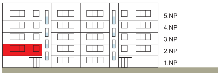
Západní pohled na dům/ Building View - West side